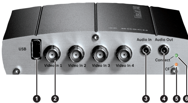
VideoJet X40 SN — 正面